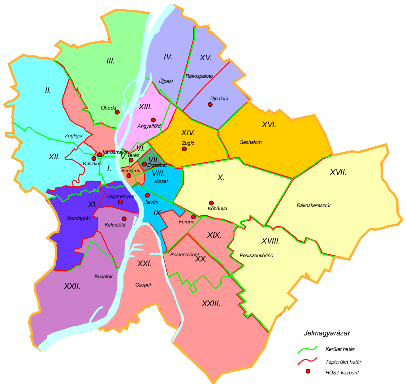
1.2. ábra. A budapesti Helyi Zónák földrajzi elhelyezkedése