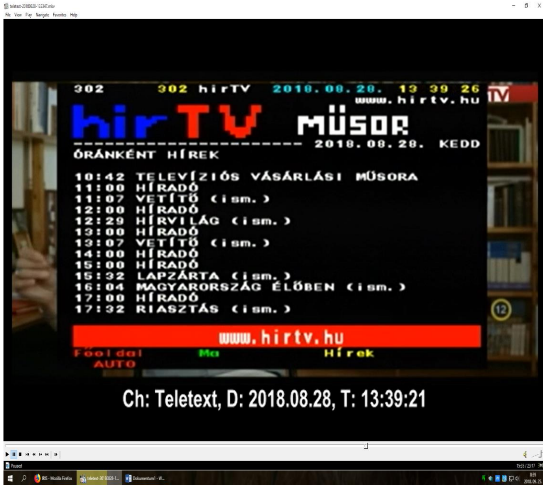
Hír TV internetes újságban szereplő műsorai 2018. augusztus 28.