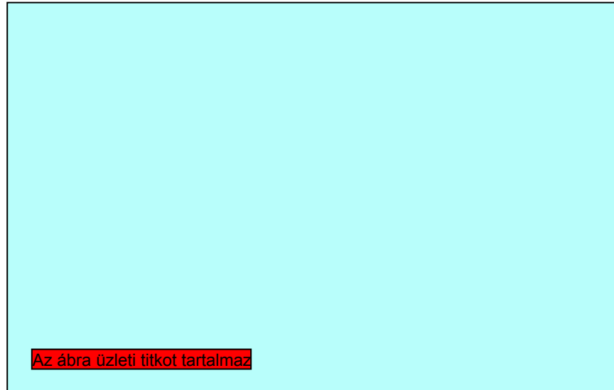
4. ábra: Az egyes szolgáltatók végződtetési bevételeinek aránya az összes bevételhez

Vizsgálatra került továbbá, hogy az érintett piacon realizált bevétel milyen súllyal szerepel az adott szolgáltató összes bevételében. A számítás eredményét a 4. ábra mutatja.