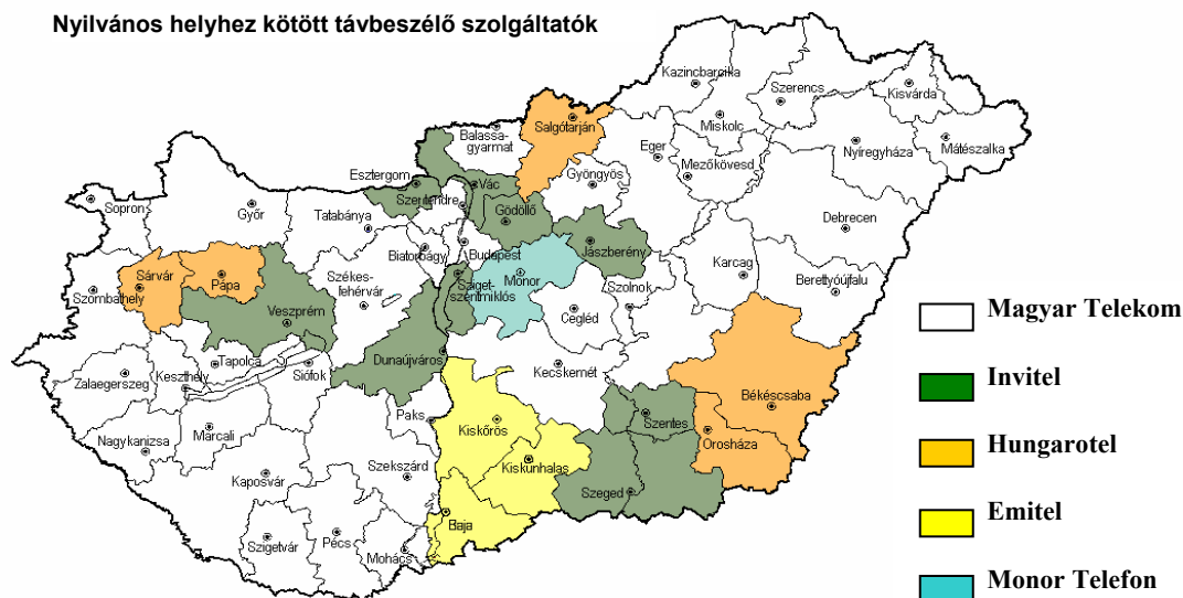
2. ábra. A vizsgált szolgáltatók alapvető szolgáltatási területe.

A volt koncessziós szolgáltatók kiskereskedelmi szolgáltatási területe a Magyar Köztársaság területén a következőképpen alakul: